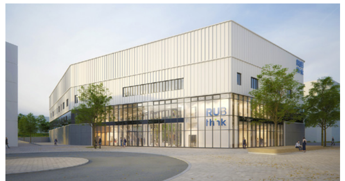
So wird der Forschungsbau THINK eines Tages auf dem Technologie-campus Mark 51/7 aussehen.

Und ein weiterer Meilenstein ist absehbar: Auf dem ehemaligen Opel-Gelände fand im März das Richtfest für das neue Zentrum für Theoretische und Integrative Neuro- und Kognitionswissenschaft (THINK) statt. Das mit 89 Mio. € von Bund und