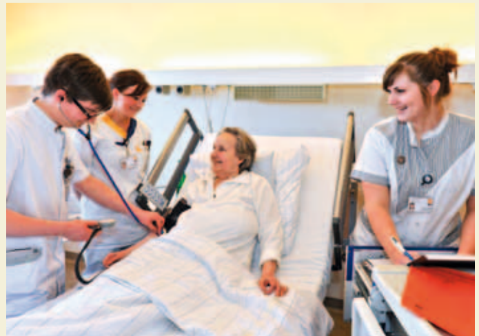
Evangelisches Krankenhaus Mülheim an der Ruhr.