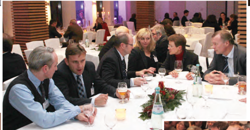
Kindermediziner tauschten sich noch zu später Stunde aus.