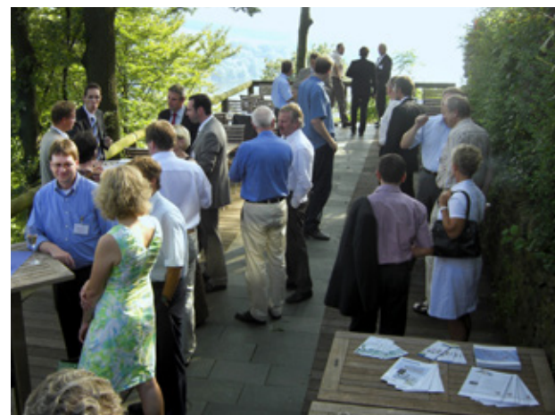
Das erste Sommertreffen 2008 im Haus Schellenberg in Essen