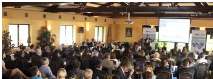
10 Jahre MedEcon Sommertreffen in der ZOOM Erlebnisswelt Seite 4