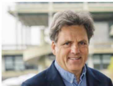
PURE/SFB 642 Zwölf Jahre Proteinforschung Seite 24

2007 – 2017 10 JAHRE MEDECON RUHR Gut gewachsen – weit verzweigt