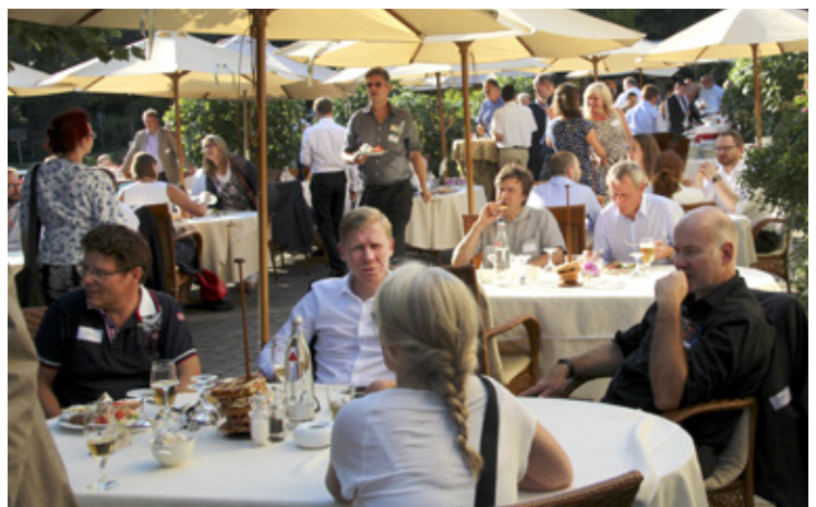
Sommertreffen 2015 im Schloss Berge in Gelsenkirchen