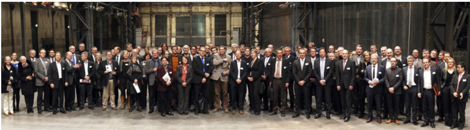
Jahreshauptversammlung 2014 in der Jahrhunderthalle in Bochum

In einem breiten Spektrum von Akteuren kommt es darauf an, Themen der regionalen Versorgung im Ruhrgebiet wie auch der medizinisch-technologischen Innovation gleichermaßen ins Blickfeld zu nehmen. Schön ist es in diesem Zusammenhang, neben den vielen Projekten und Gemeinschaften mitzuerleben (z.B. wieder auf dem jüngsten Sommertreffen), wie sich engagierte Frauen und Männer aus ganz unterschiedlichen Zweigen und „Winkeln“ von Gesundheitswirtschaft und Gesundheitswissenschaften einander begegnen – ein Vorgang, der uns allen bei aller professionellen Spezialisierung im Gesundheitswesen gut tut und ein wesentliches Merkmal von MedEcon Ruhr darstellt.