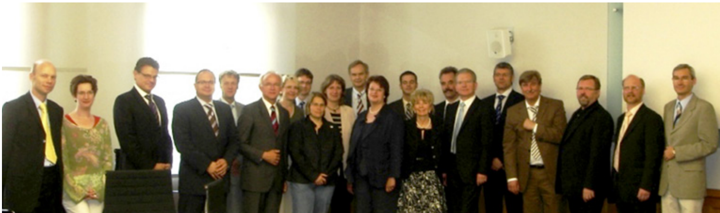
Vereinsgründung 2007 am Hauptsitz der Knappschaft-Bahn-See in Bochum

und medizinwirtschaftlicher Innovationen einbezogen werden. Der Weg: Innovationspartnerschaften zwischen Kliniken, wissenschaftlichen Einrichtungen und zuliefernden Unternehmen. Daher wurde das Vorhaben von 2009 bis 2012 nicht nur