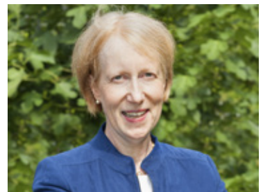
UK Essen/Innovationsfonds Telemedizin für Hausärzte Seite 20