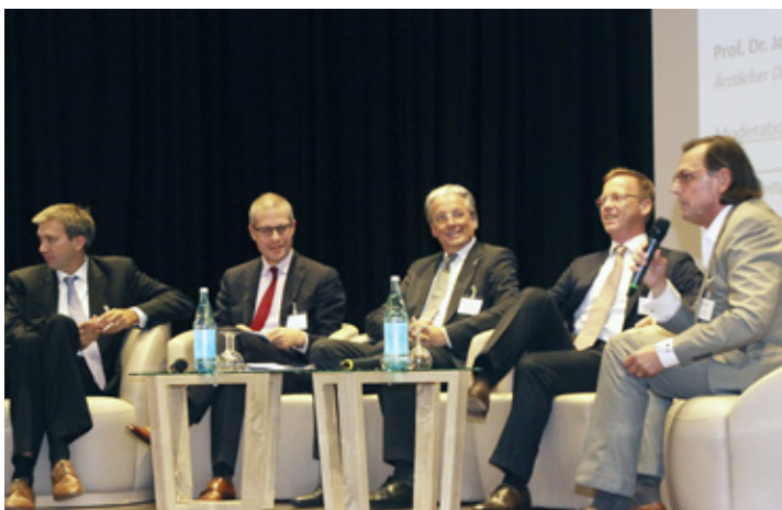
Podiumsdiskussion auf dem Klinikkongress 2016 in Dortmund