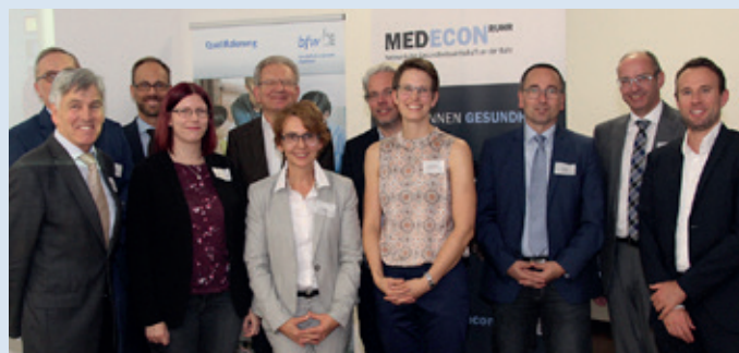
Die Referenten und Moderatoren der Tagung

Auf dem von MedEcon Ruhr ausgerichteten Chronic Care Congress im Juni 2019 wird das Thema weiter vertieft werden. Die Herausforderungen zur Teilhabe am gesellschaftlichen Leben und somit auch Teilhabe am Arbeitsleben mit einer chronischen Erkrankung werden aus verschiedenen Blickwinkeln beleuchtet und gleichzeitig soll ein politisches Bewusstsein für diese Problemlagen geschaffen werden.